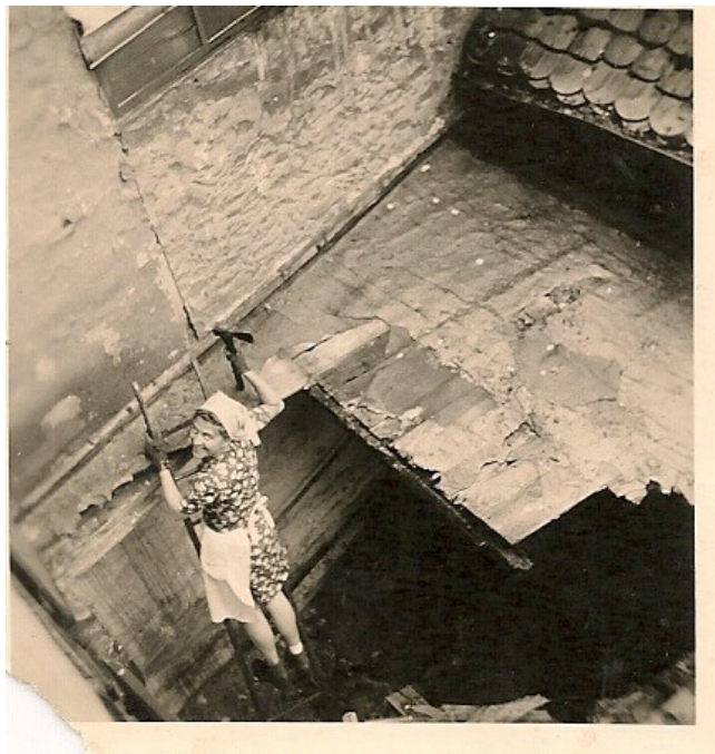
Fraulein Pletsch 1946 in Neustadt