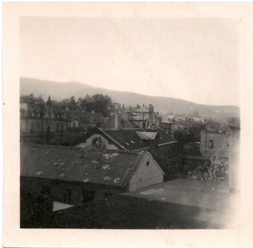
Vue des toits du 42 Landauerstrasse