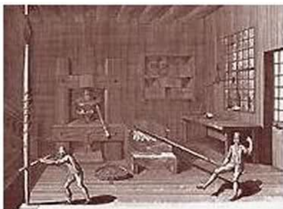
Atelier du vermicellier en 1771

*La brie est l'objet en bois en bas de la planche du milieu