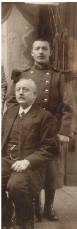
En militaire lors de son service au 26° RI à Nancy en déc. 1912