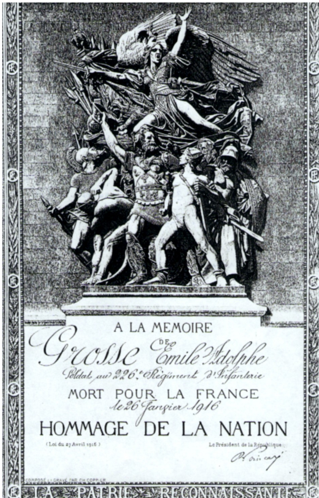
Document envoyé à sa mère à Nancy