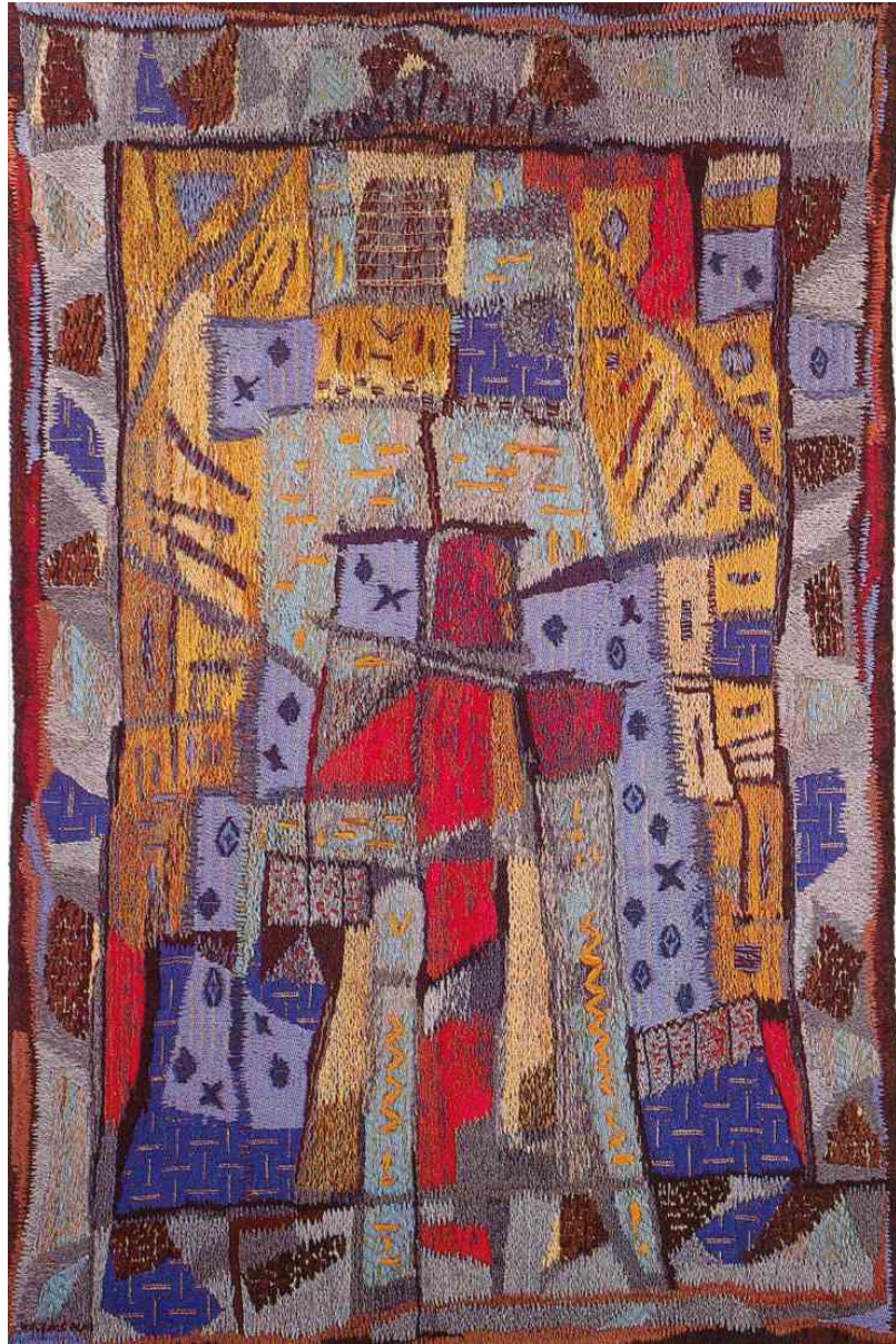
Tapissérie brodée de 1968 au Pensionnat Salve Regina de Bourguillon en Suisse