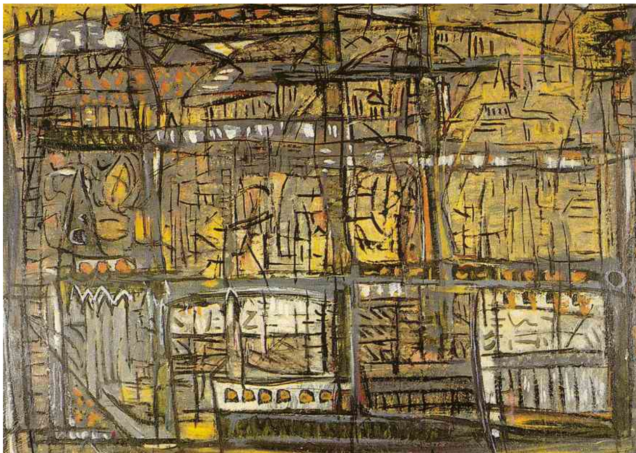
Faubourgs 1964 Toile à la Fondation Soulac